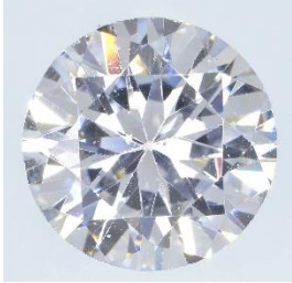
（写真1） フェースアップ

キュービックジルコニア（写真1）を拡大検査するとダイヤモンドと異なるだれたファセットエッジ（写真2）とガードルの研磨状態（写真3）が観察される場合がある。