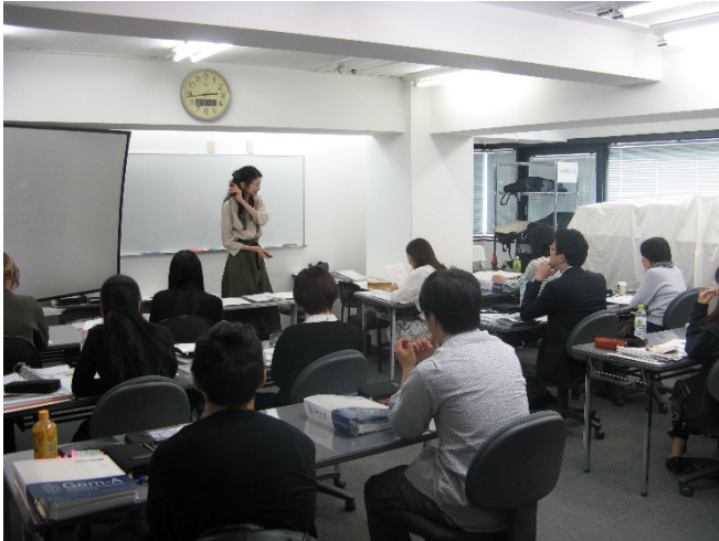
ファンデーション試験特訓セミナーに取り組む受験生

6月18日から Gem-A 宝石学コースのファンデーション（基礎課程）ならびにディプロマ（上級課程）試験が行われます。試験に向けて、試験対策セミナー、模擬試験、宿題問題など受験生は奮闘努力の今日この頃です。通学制の学生に加え、通信制の受講生が九州や関西からも参加されています。